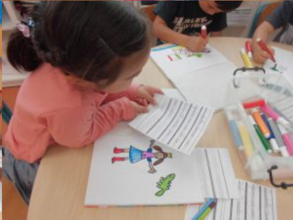
Posted in:Archives 2015-2016 | | With 0 comments