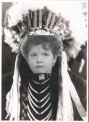
CHAUVE SOURIS MAJIN