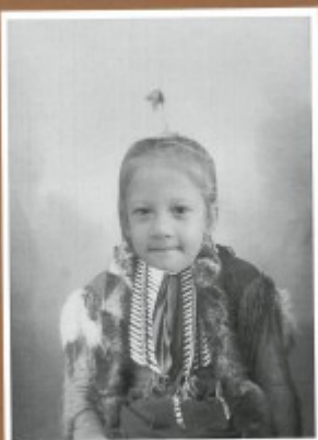
DURIS AMOUREUX E